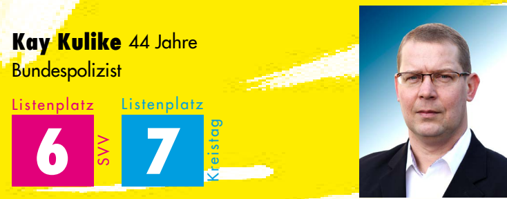
Kay Kulike 44 Jahre Bundespolizist

6 Schaffung einer Direktverbindung von und nach Berlin. Langfristiger Anschluss von Bad Freienwalde an das S-Bahn-Netz. Schnellstmöglicher Ausbau des Breitbandes bis zur letzten Milchkanne. Sofortiger Stop des Umbaus der Postgebäudes und Bau einer Schwimmhalle. Wir setzen uns auf allen Ebenen für die Abschaffung der Straßenausbaubeiträge ein.